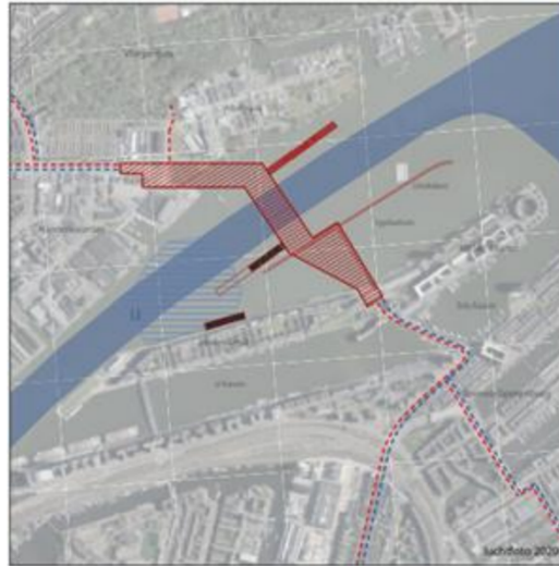
Zoekgebied Oostbrug en aantakking op bestaande routes